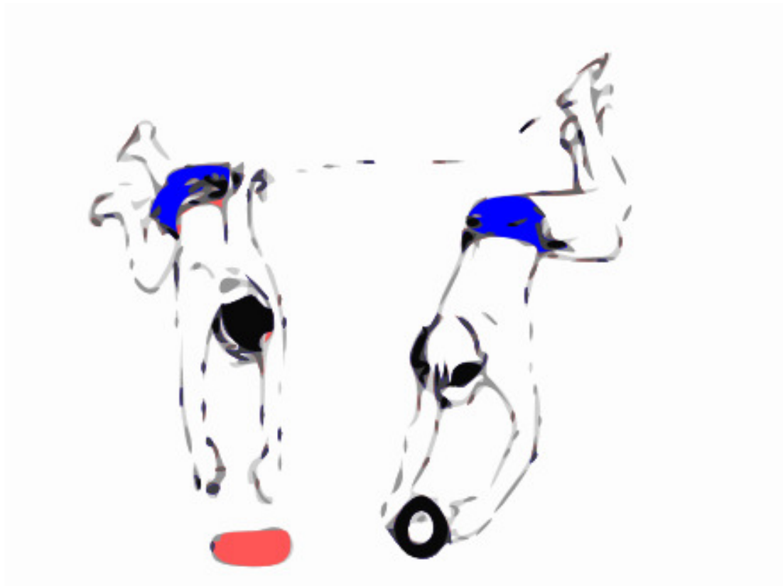
Attraper des objets au fond de l'eau.